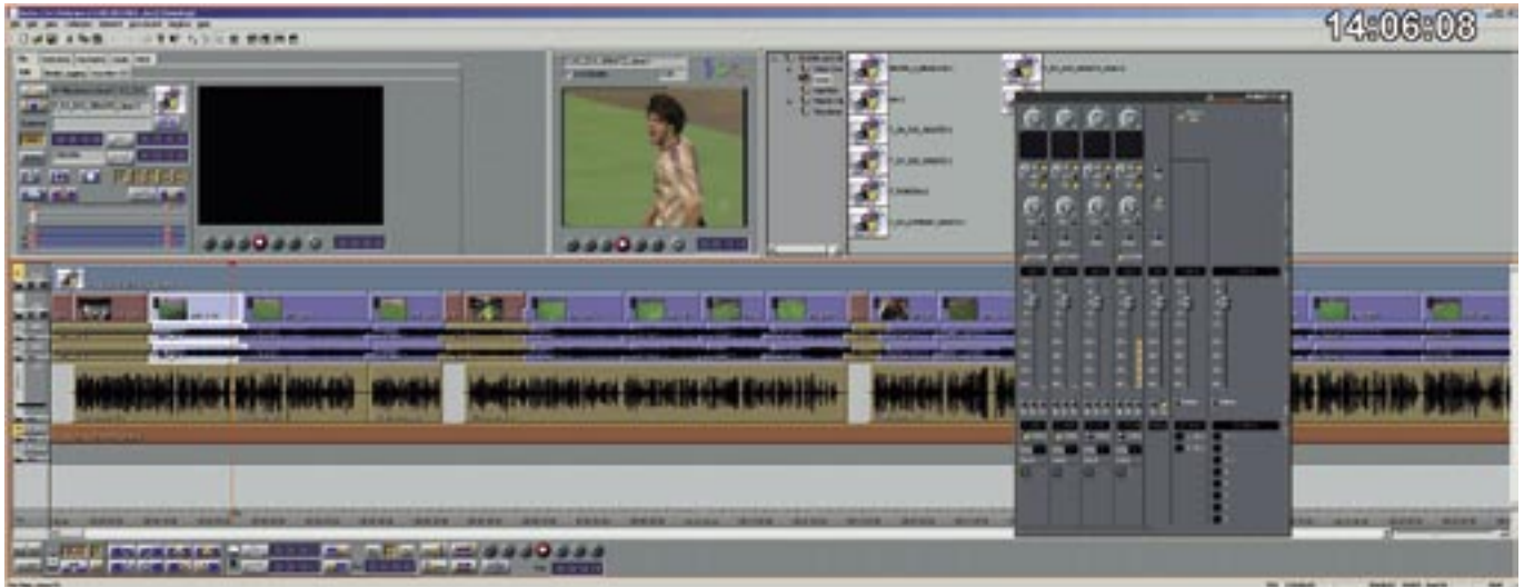
Abmischen der Spieltagszusammenfassung 1.Liga aus neun Spielen mit der Software „Incite»