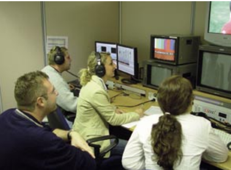
Teamwork zwischen Logger, Kommentator und Cutter in der Videoredaktion der Plazamedia: Das Highlight aus dem Stadion wird ausgekoppelt, kommentiert und auf exakt zehn Sekunden Länge geschnitten