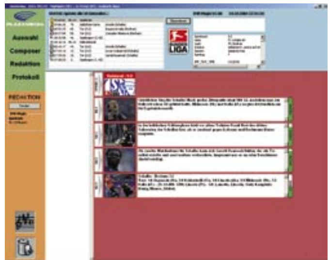
Erstellung einer Endstands-Bild-MMS im Plazamedia Redaktionssystem (PMRS)

In der Videoredaktion verfolgen jeweils Dreier Teams – bestehend aus Bildredakteur, dem sogenannten Logger, Kommentator und Cutter – das ihnen aktuell zugeteilte Spiel. Jeder der insgesamt sechs Schnittplätze verfügt über einen PC mit Monitor, auf dem über das Redaktionssystem auch die Metadaten der Fussball-Datenbank IMP zugespielt sind, einen Playout-Monitor für den Logger, einen weiteren Monitor für den Kommentator sowie das Schnitt-Equipment mit Incite-Bearbeitungssoftware und Geeserver. Fällt im Weserstadion ein Tor, wird am Betzenberg die rote Karte gezückt oder zur Halbzeit gepfiffen, heißt es für das Dreiergespann Gas geben. Jetzt muss alles blitzschnell gehen. Binnen vier Minuten soll der fertige Clip an den Kunden-Server ausgeliefert sein.