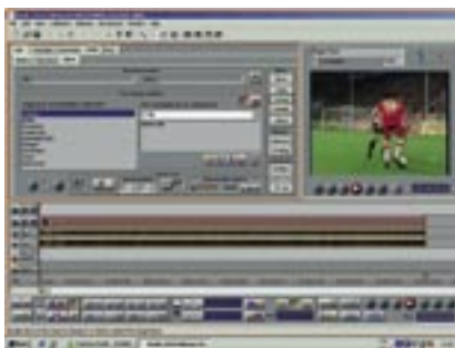
Abmischen eines zehnekündigen Near Live Clips für die Bundesliga MMS-Produktion